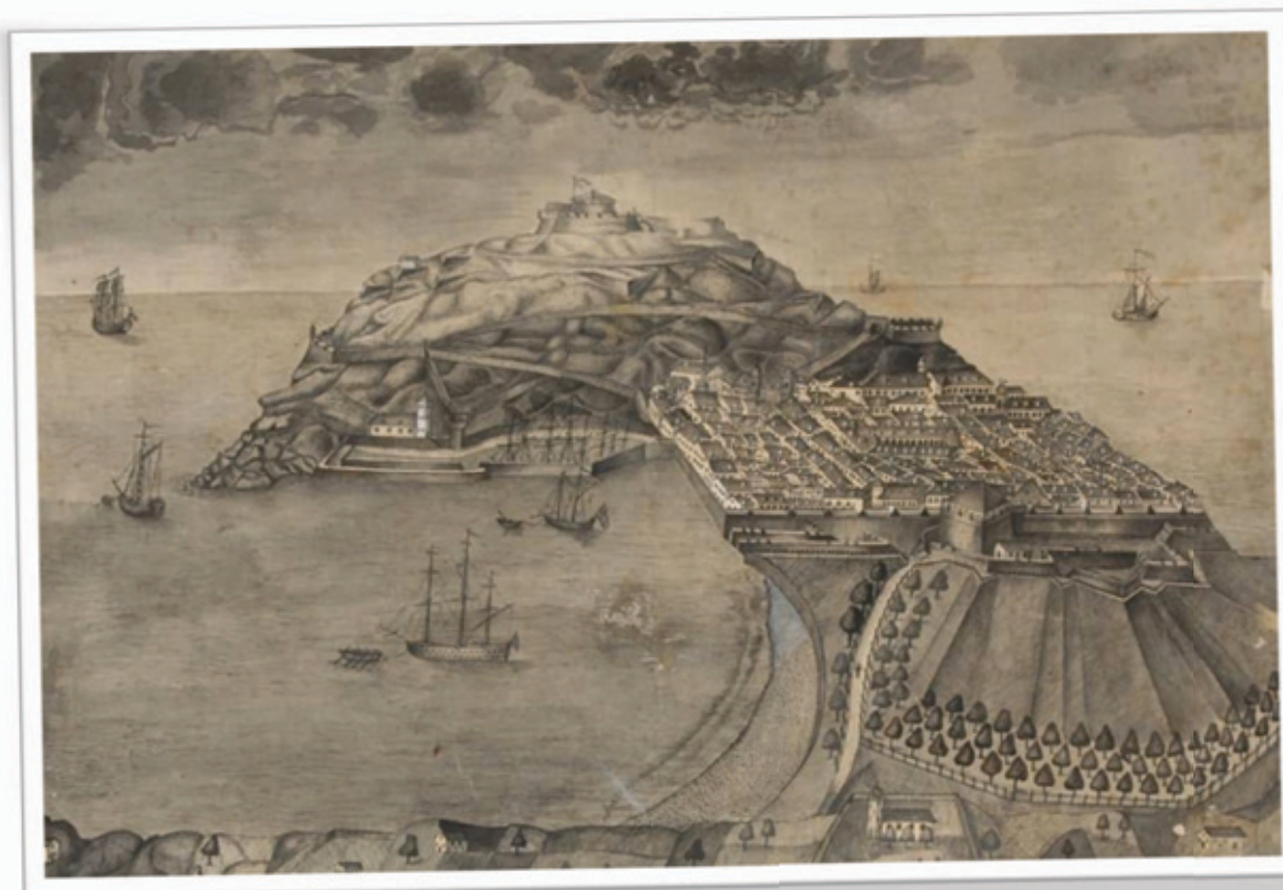
"Donostia", egile ezezaguna, XIX. mendea