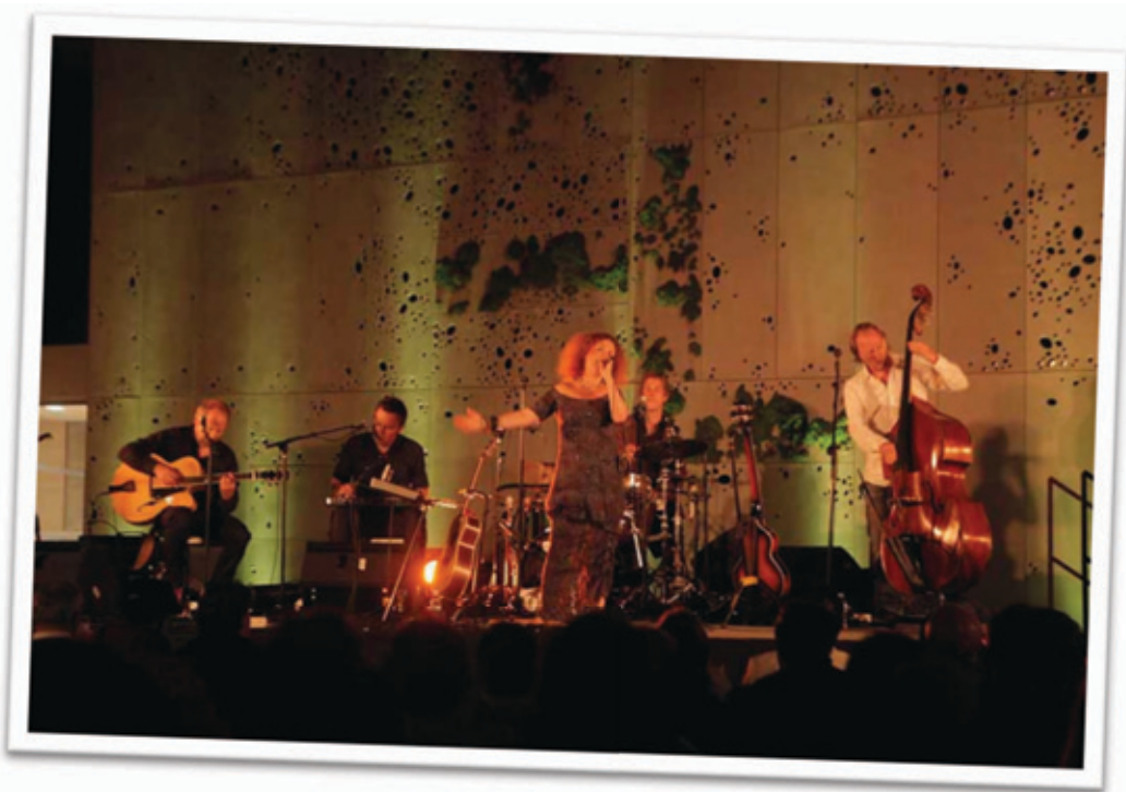
Egilea: Lolo Vascos

Uda hasten den hilabete honetan, gogoratzeko, ezagutarazteko, elkartrukatzeko, kiroltasunez lehiatzeko, solasean aritzeko, dantzatzeko, amets egiteko... aktibitatez blai dator programazioa.