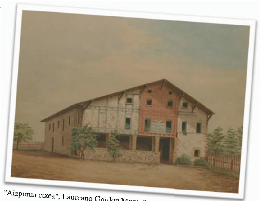
"Aizpurua etxea", Laureano Gordon Montaña

Irailaren 8an 200 urte beteko dira hiriaren suntsiketaren biktimen ordezkariak, Zubieta auzategiko Aizpurua etxean bilduta, Donostia berreraikitze gogo irmoa adierazi zutela.