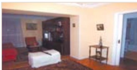
AMARA. Avda. Madrid. Piso exterior con balcón a reformar con muchas posibilidades. 330.000 €. Ref.: C02451.