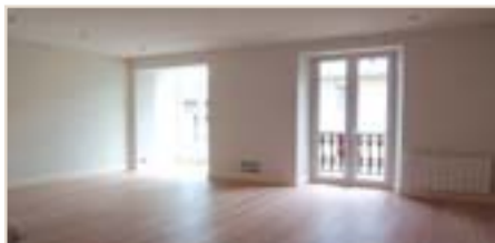
CENTRO. C/ Urdaneta. Amplio piso a estrenar de salón, cocina, 2 habs., gran vestidor y 2 baños. Garaje. Nuevo precio: 649.000 €. Ref.: C01558.