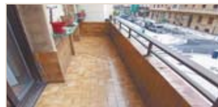
GROS. Jto. Zurriola. Piso muy exterior con balcón a reformar con muchas posibilidades. Muy soleado. Hormigón. 420.700 €. Ref.: C01705.