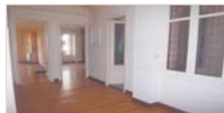
GROS. Ppio. Pº Colón. Señorial y amplio piso de salón, 4 habs., cocina, baño y aseo. Alto. Muchas posibilidades. Ref.: C02437.