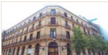
CENTRO. C/ Getaria. En edificio de reciente construcción. Impecable apartamento casi a estrenar. Ref.: C01896.