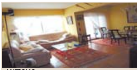
ANTIGUO. Miqueletes. Amplio y luminoso piso de salón, cocina, 3 habs., 2 baños y office. Gran terraza con muchas posibilidades. Trastero. Ref.: C02311.