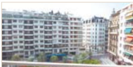
CENTRO. Plaza Zaragoza. Magnífico piso de 109 m 2 , todo exterior de esquina alto y con vistas despejadas. Hormigón. Ref.: C02088.