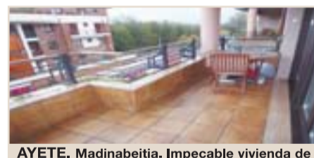
AYETE. Madinabeitia. Impecable vivienda de rec. construcción. Toda exterior. Salón, 3 habs. dobles, cocina y dos baños. Mejoras. Terraza muy agradable de 10 m 2 . Garaje cerrado. Ref.: C02172.