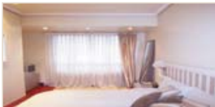
AYETE. Pº Ayete. Precioso dúplex reformado de salón, cocina, 2 habs. y 2 baños. Bajocubierta de 20 m 2 con velux. Garaje. Ref.: C01894.